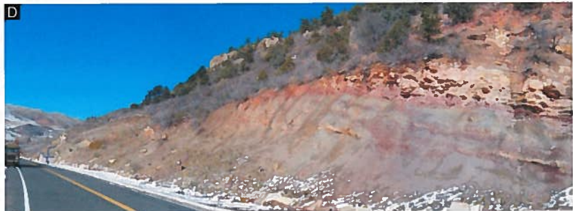
ロウリンニャ層とモリソン層